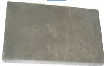
geschlossene Platte Auch in 40 cm Breite lieferbar