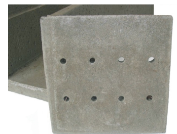
Stallroste mit Löchern