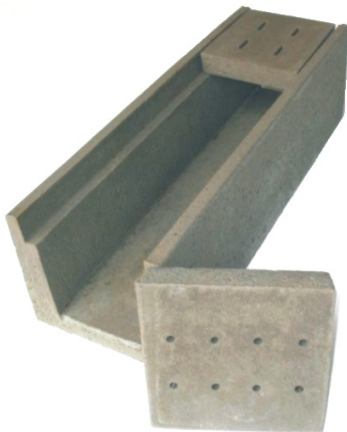
U-Kanal mit Stallrosten