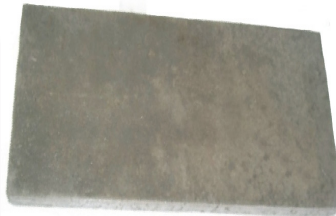
geschlossene Platte Auch in 40 cm Breite lieferbar