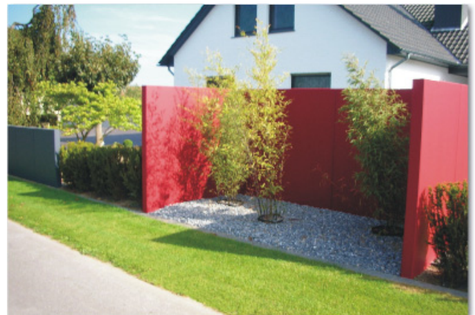
prägnant, lebendig, unaufdringlich

Was halten Sie von der Idee- etwas zu verändern?