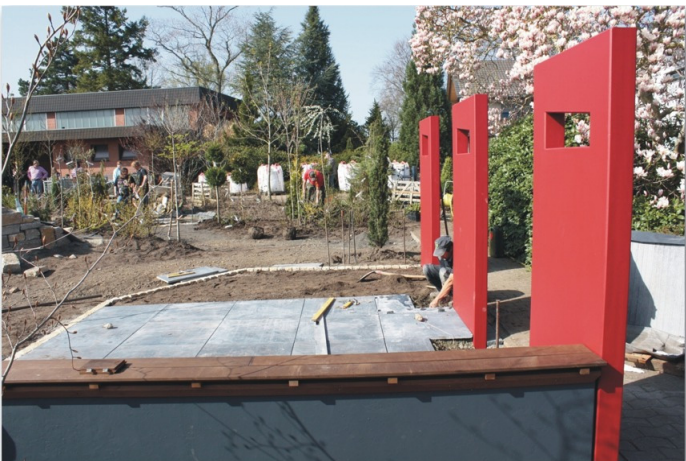
Gartengestaltung mit Einzelstelen in der Ideenküche der Firma CONCEPT G, Oppenwehe