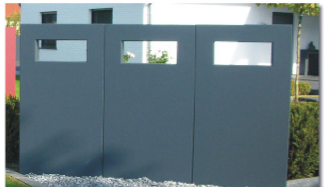
TOP- Wirkung durch klare Formsprache