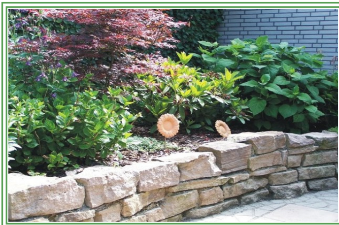
Trockenmauer (gesägte Flächen) aus "Ibbenbürener Sandstein" in Lehm gesetzt

Mit Sandstein lassen sich Gärten auf vielfältige Weise gestalten und seinem Einsatz sind dabei kaum Grenzen gesetzt. Sandstein kann als Bodenbelag mit Pflastersteinen und Bodenplatten, als Trockenmauer mit Mauersteinen, als Treppenanlage mit Blockstufen, oder für die Gestaltung von Wasserläufen und Teichen mit Schüttsteinen verwendet werden.