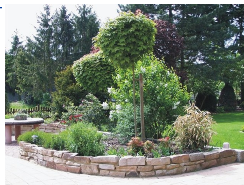
Hochbeet mit Trockenmauer aus "Ibbenbürener Sandstein" mit Schnittkante - in Mörtel gesetzt -

Ibbenbürener Sandstein wird zu Mauersteinen, Fenstern und Tüргewänden, Verblendung, Blockstufen und Bodenplatten verarbeitet. Er ist frostbeständig und im Innen- und Außenbereich einsetzbar. Die Druckfestigkeit reicht an die Werte grobkörniger Granite heran.