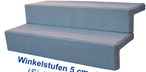
Winkelstufen 5 cm stark (Sichtbeton glatt)