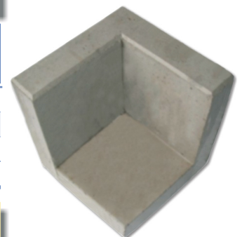
Eckstein (einteilige Aussenecke)