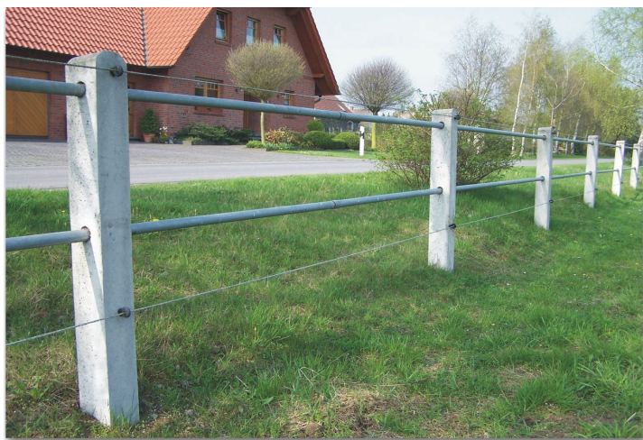
Pferdekoppel (mit 1 1/4 " Stangeneinzäunung u. Elektro-Weidezaun)