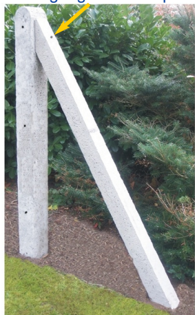
Betonpfahl mit Strebe

Lochdurchführung zur Befestigung am Betonpfahl