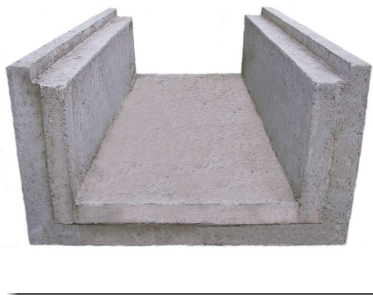
Abdeckung auf Anfrage