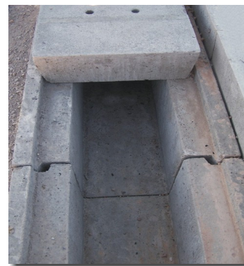
Entwässerungskanal für Oberflächenwasser (mit Nut + Feder)