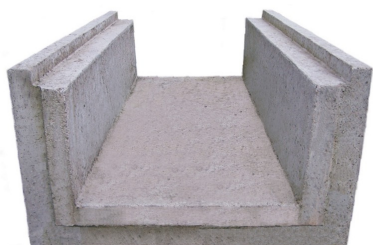
Abdeckung auf Anfrage