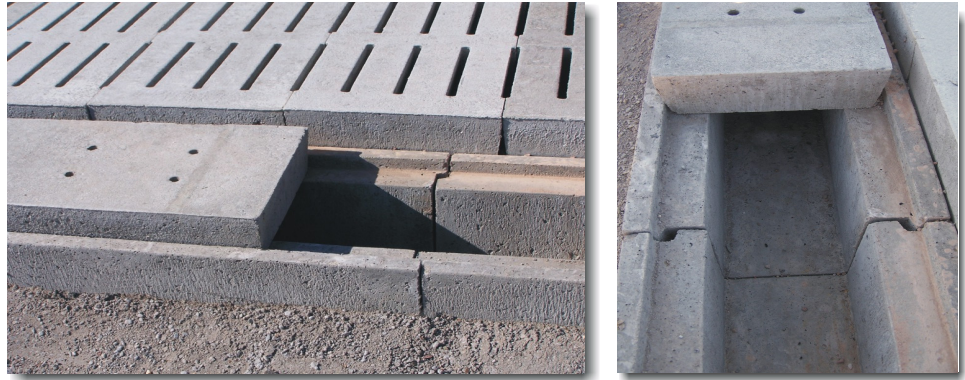
Entwässerungskanal für Oberflächenwasser (mit Nut + Feder)