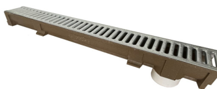
mit eingegossenen Stutzen